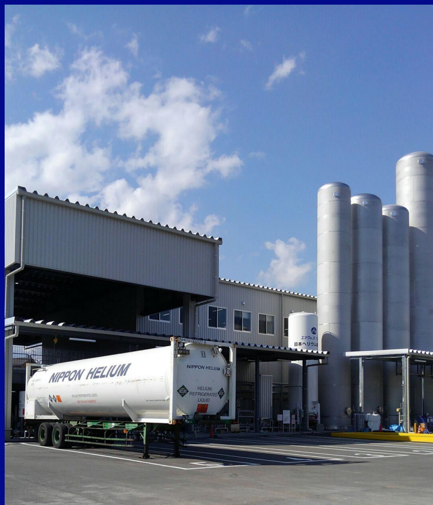
センター工場外観